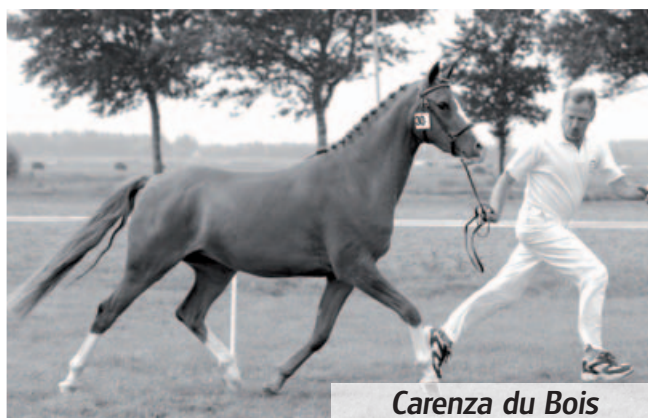
Carezza du Bois

Bij de 14 nakomelingen van Camyrah zaten twee belangrijke opvolgers, Chamaya du Bois keur, prest.sport (1999, v. Dornik B, stokmaat 1.48 m) en Carice du Bois voorl. keur, preferent (2008, v. Der Harlekin B, stokmaat 1.48 m), plus de goedgekeurde hengst Don Carino du Bois (2004, v. Deinhard B). Van Don Carino staan 35 nakomeling geregistreerd bij het NRPS, onder andere de EK dressuurpony en goedgekeurde hengst Don Davino Horsepoint. Chamaya du Bois heeft via dochter Nikki van de Boxenhof (2005, v. Napoleon) een kleinzoon die sinds 2019 Z2+40 dressuur op zijn naam heeft